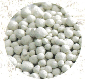
KALKDÜNGER Algenkalk, Magnesiumkalk, Kohlensaurer Kalk