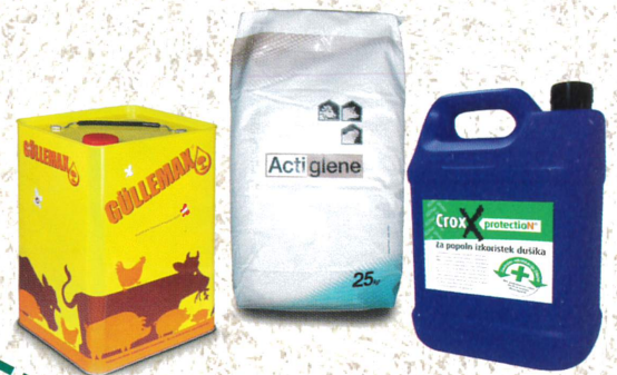
GÜLLEZUSÄTZE Actiglène, Güllemax, CroxxProtection – Nitrifikationshemmer