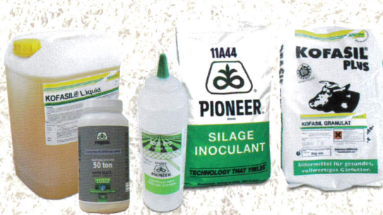
SILIERHILFSMITTEL Kofasil und Pioneer

Jetzt bestellen mit FRÜHBEZUGSRABATT und größtmöglicher Auswahl!